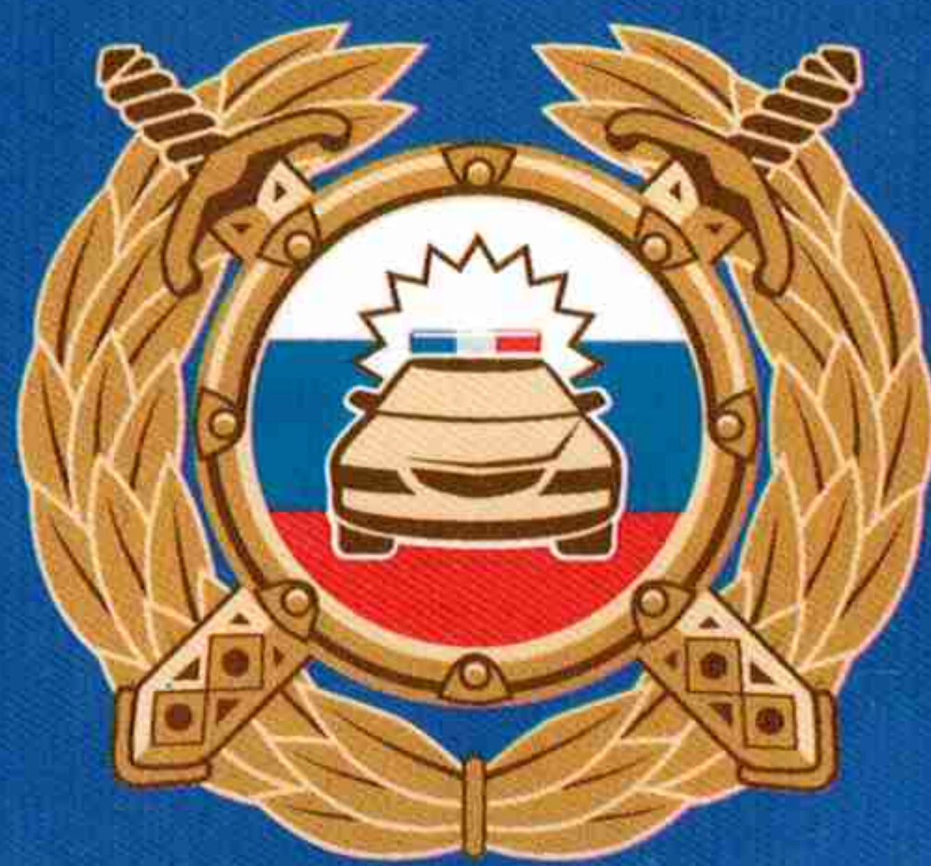
Госавтоинспекция МВД России

Буклет изготовлен по заказу Минпросвещения России в рамках реализации федеральной целевой программы «Повышение безопасности дорожного движения в 2013–2020 годах».